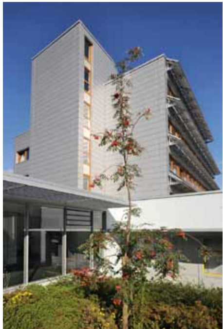
Die Hochschule für Kirchenmusik der Diözese Rottenburg- Stuttgart