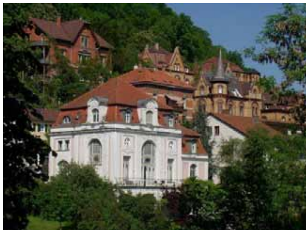
Das „Schwabenhaus“, erbaut 1899, ehemaliges Verbindungshaus der Studentenverbindung „Suevia“, ein denkmalgeschütztes Gebäude am Neckar, ist das Domizil der Hochschule für Kirchenmusik Tübingen.