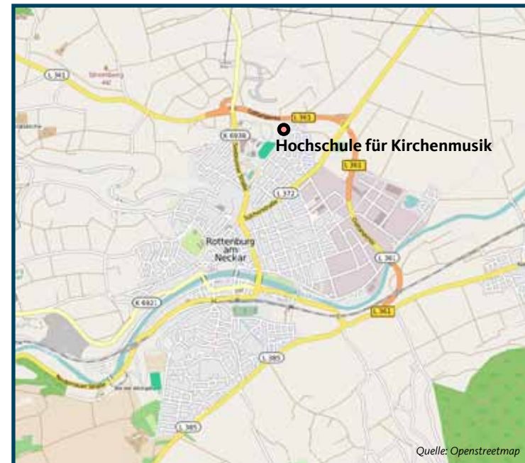
Lageplan der Rottenburger Hochschule