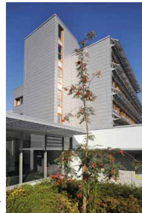
Die Hochschule für Kirchenmusik der Diözese Rottenburg-Stuttgart