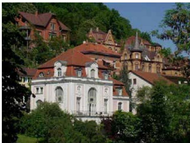
Das „Schwabenhaus“, erbaut 1899, ehema- liges Verbindungshaus der Studentenverbin- dung „Suevia“, ein denkmalgeschütztes Gebäude am Neckar, ist das Domizil der Hochschule für Kir- chenmusik Tübingen.