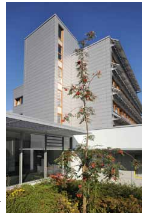
Die Hochschule für Kirchenmusik der Diözese Rottenburg- Stuttgart