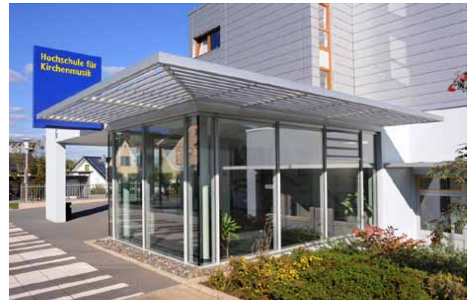
Der Eingangsbereich der Rottenburger Hochschule für Kirchenmusik

Lehrinhalte dieses Blockseminars sind Anatomie und Physiologie von Atem- und Stimmapparat, Pathologie, Stimmhygiene, Stimme in der Lebenszeit, Stimmakustik, Stimmanalyse und Stimmregister.